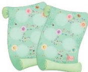
2 kincses térkép