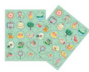
2x20 áthelyezhető nyomjelző matrica